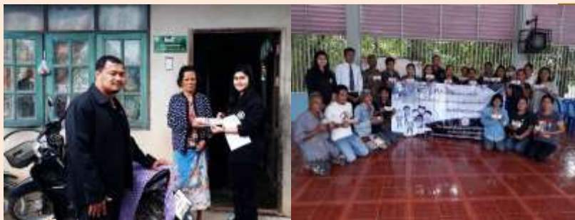
24 ม.ค.60 เจ้าหน้าที่บ้านพักเด็กฯ มอบเงินสงเคราะห์เด็กใน ครอบครัวช่วยเหลือเด็กขาดแคลนและเด็กฝากเลี้ยงตามบ้าน ณ ต.เขาชัยสน อ.เขาชัยสน จ.พัทลุง