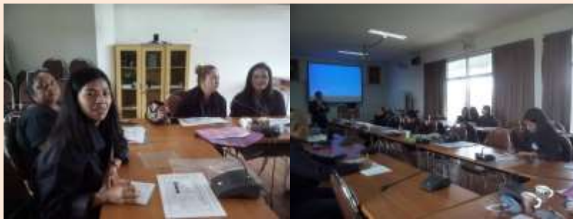
24 ม.ค. 60 เข้าร่วมการประชุมเชิงปฏิบัติการการจัดทำแผน ยุทธศาสตร์พัฒนาสังคมและความมั่นคงของมนุษย์จังหวัดพัทลุง พ.ศ.2560-2564 ณ สถาบันพัฒนาองค์กรชุมชน ตำบลตำนาน อำเภอเมือง จังหวัดพัทลุง