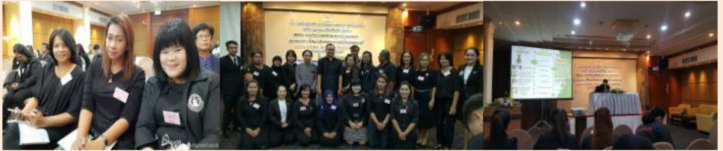
24 - 27 ม.ค. อบรมเชิงปฏิบัติการเสริมสร้างศักยภาพครอบครัวลดความรุนแรงในเด็กเล็ก รุ่นที่ 1 ณ โรงแรมเดอะทวิน ทาวเวอร์ กทม