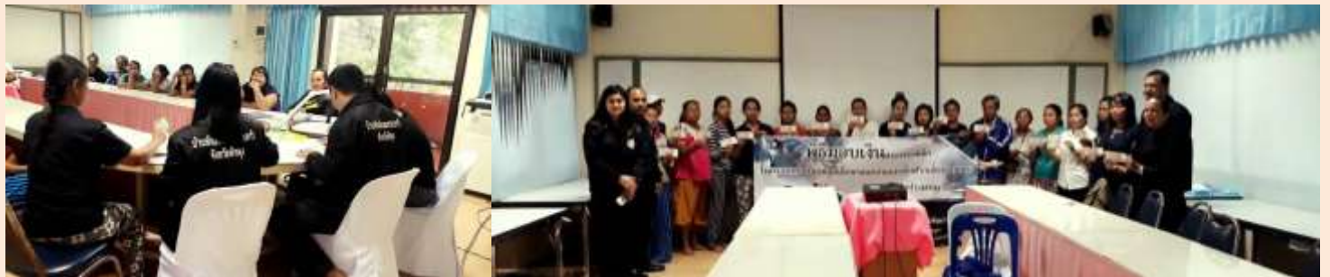
24 ม.ค. 60 เจ้าหน้าที่บ้านพักเด็กฯ มอบเงินสงเคราะห์เด็กในครอบครัวช่วยเหลือเด็กขาดแคลนและเด็กฝากเลี้ยงตามบ้าน ณ โรงเรียนปากเหมือง อำเภอป่าพะยอม จังหวัดพัทลุง